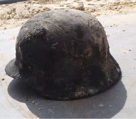
De gevonden Duitse helm