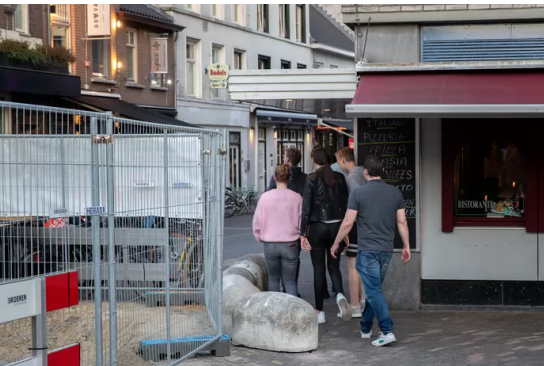
Voor bezoekers van Stratumseind bleef maar een hele smalle doorgang over