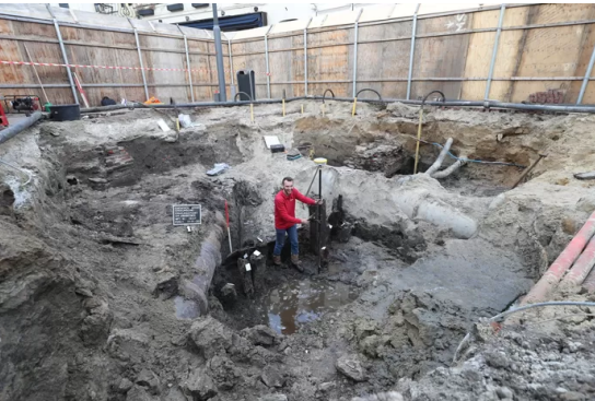
In 2020 werd al een stadspoort uit de Middeleeuwen gevonden op het pleintje halverwege Stratumseind