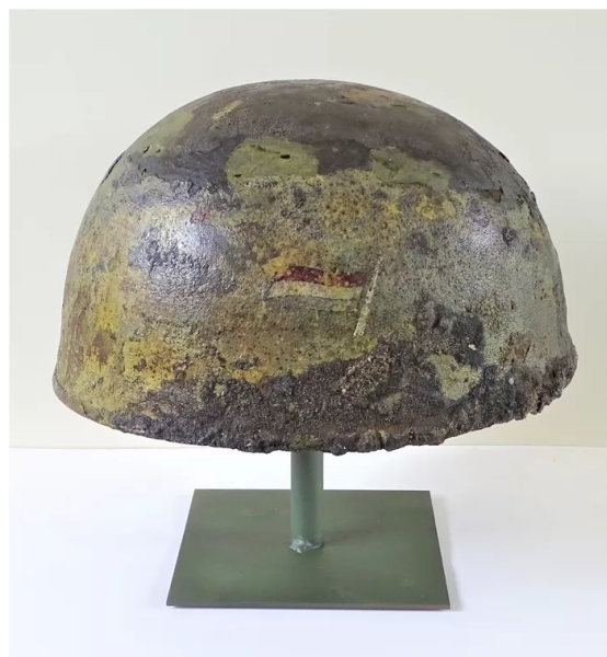
De Britse of Canadese helm met Nederlandse vlag

Het nu gevonden muurtje is zo'n 400 jaar jonger en maakte volgens de gemeente ook onderdeel uit van een brug die over de in 1940 gedempte stadsgracht dwars over Stratumseind liep. Historisch dus minder opzienbarend maar toch moest het volgens de gemeente in kaart worden gebracht. Nu dat gebeurd is, kan de bouwput weer voor een deel worden dichtgegooid. Het met bouwhekken afgezet gebied wordt dan een stuk kleiner en daarmee ook de overlast.