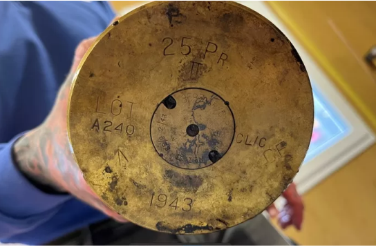
De Britse granaat

De gemeente laat in een reactie weten de gang van zaken te betreuen. Met club Xi is inmiddels een gesprek geweest en het terras van La Fontana krijgt volgens de planning in juni nieuwe bestrating